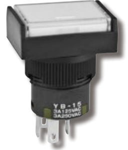
YB 系列的点发光按钮开关

由于受 LED 的厂家的停产影响，YB 系列的点发光的盖帽的内置 LED 的规格的变更。受影响的是无电阻（红 / 绿）和带有 12 伏电阻（红 / 绿）。无电阻（红 / 绿）的 02 编号的电气参数的变更请参照下表。带有 12 伏电阻（红 / 绿）的电气参数没有变更。具体的型号变更请参照第 2 页。