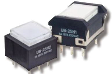
UB 系列的白光超光亮 LED

UB系列的发光按钮开关和指示灯的白色超高亮LED规格变更(LED厂家停产), 变更将导致与以前的LED电气参数存在差异, 此次变更包括标准型号和定制型号。下表是规格变更前后的对照参数, 具体的开关型号请参照第二页。