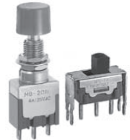
MB 按钮和 MS 滑动开关的更改

EB 和 MB 按钮和 CS 和 MS 滑动开关的生产区域将由中国厂家变更为菲律宾厂家。开关箱侧面的批号在第二位数上带有点标记,而不是在第一位数上。开关的包装箱上印有“PHILIPPINES FACTORY”而不是“CHINA FACTORY”。所有这些更改将适用于定制和标准产品。