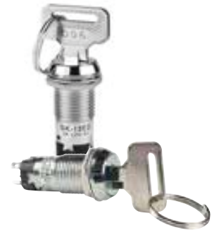
SK 低和中安全性钥匙锁开关

1. SK 低和中安全性钥匙锁开关的地址和生产更改。产品上不再出现产地，NKK 标志将被更新。开关批号上的第一位数字上有点标记。设备运输包装箱上印有“PHILIPPINES FACTORY”，而非“JAPAN FACTORY”。所有这些修订将适用于标准，定制和 UL / CSA 认可的产品。下表中列出了 SK 的有效标准零件编号。